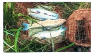
Photo : organisation de patrouille de route et poisson pêcherie Bomukandi.