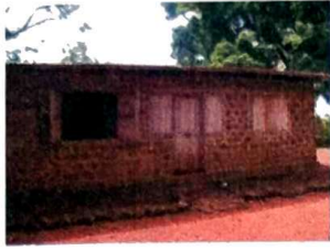
Photo : Bureau administratif site Maika Penge.