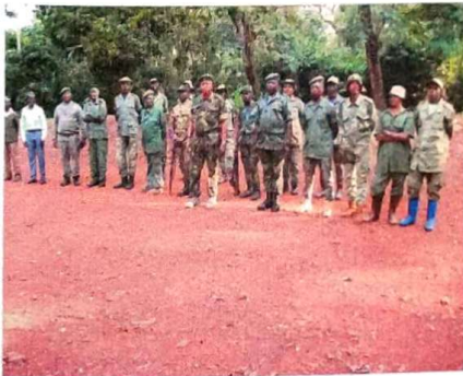
Staff Maika Penge en parade.

VOTRE SOUTIEN EST CAPITAL POUR LE DOMAINE DE CHASSE ET RESERVE DE LA MAIKA PENGE.