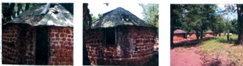
Photo maisons des écogardes

Nous sommes à la recherche des partenaires techniques et financiers pour appuyer ce site en péril.