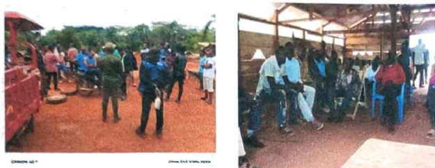
Photo : campagne d'information et de sensibilisation de la population riveraine.

d'attitude, et une meilleure compréhension des enjeux de conservation pour les communautés locales, ces activités sont menés avec le moyen de bord de l'ICCN-DCMP.