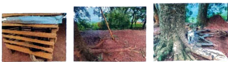
Photo : Espèces en captivité

La conservation du Domaine de chasse de la Maika Penge (DCMP) vise assurer de manière participative et inclusive, la protection de l'intégrité du DCMP de préserver sa biodiversité, ses services écosystémiques ainsi que ses valeurs culturelles et socio-économiques dans le respect des droits des communautés locales et autochtones et de l'égalité de genre au profit de l'humanité.