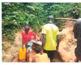
Photo : source d'eau non aménagée

Afin de réduire la pression anthropique sur les ressources naturelles, des projets soutiennent le développement d'activités socioéconomique et alternative à la chasse, notamment l'élevage, l'agriculture durable, apiculture, pisciculture y compris la production de café, cacao et transformation des produits forestiers non ligneux sont en cours, mais sans appui financier des partenaires. Ces initiatives renforcent l'autonomie économique des ménages tout en protégeant les écosystèmes du site.